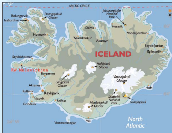
Das Kraftwerk liegt am westlichen Landzipfel Snaefellness

Der singende Riese ist Teil einer erklecklichen Schar von Fabelwesen, die zu Island gehören wie die Schafe, die Ponys und die Geländefahrzeuge. Per-