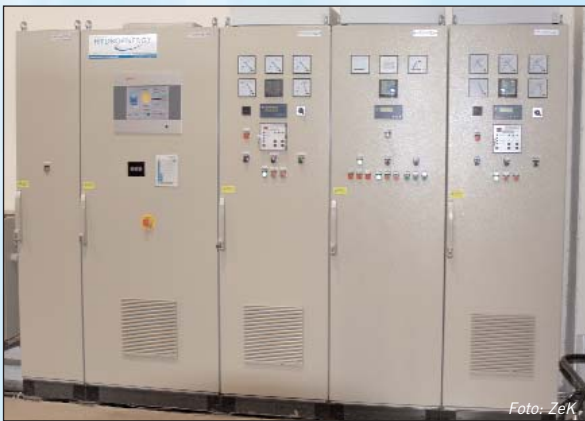
Das „Gehirn“ der Anlage: die Steuerungsanlage von GHE. Letzte technische Details wurden im Frühling '06 vor Ort integriert.