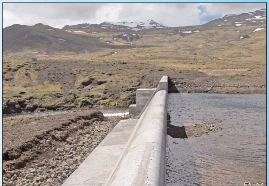
Beim Bau des Staudamms wurde darauf geachtet, dass die Brutplätze der Vögel erhalten bleiben.