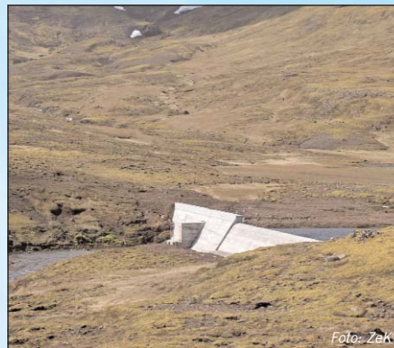
Im Einklang mit der Natur: Beide Staumauern wurden in der Landschaft regelrecht „versteckt“.

wohner vollständig intakt bleibt. Daher haben wir eine großzügige Restwassermenge, gerade vom oberen Stausee, eingerichtet, um die Brut der vielen Vö-