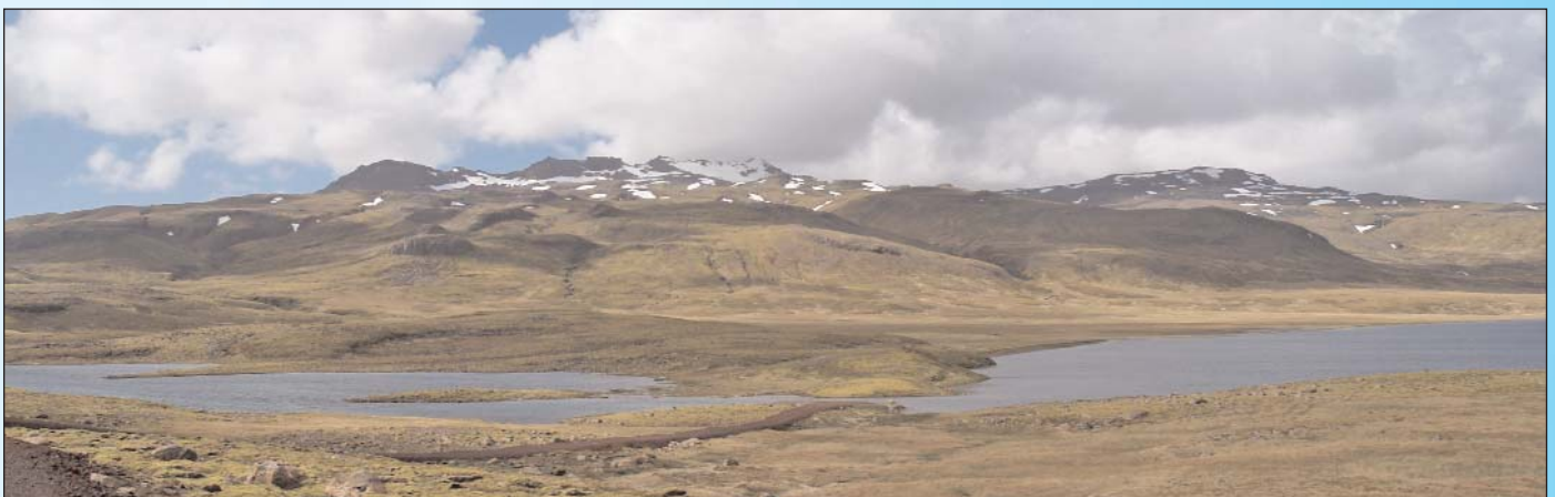
Steigt der Strombedarf, wird mehr Wasser vom oberen Stausee in den unteren abgelassen. GHE entwickelte eine spezielle Steuerung dafür.

Damit hat Eggert nun auch ein Trostpflaster für die dunkle Jahreszeit auf Island – von Dezember bis Februar – gefunden. Schließlich gilt diese Periode als die hydrologisch stärkste. Und seine ersten Erfahrungen sind vielversprechend. „Wir sind im November mit dem oberen Stausee fertig geworden. Im Dezember kam dann der Schnee - und später der Regen. Und wir konnten mit der Produktion richtig loslegen. Anfang Februar erreichten die Maschinen bereits ihr Leistungsmaximum“, erzählt der Betreiber.