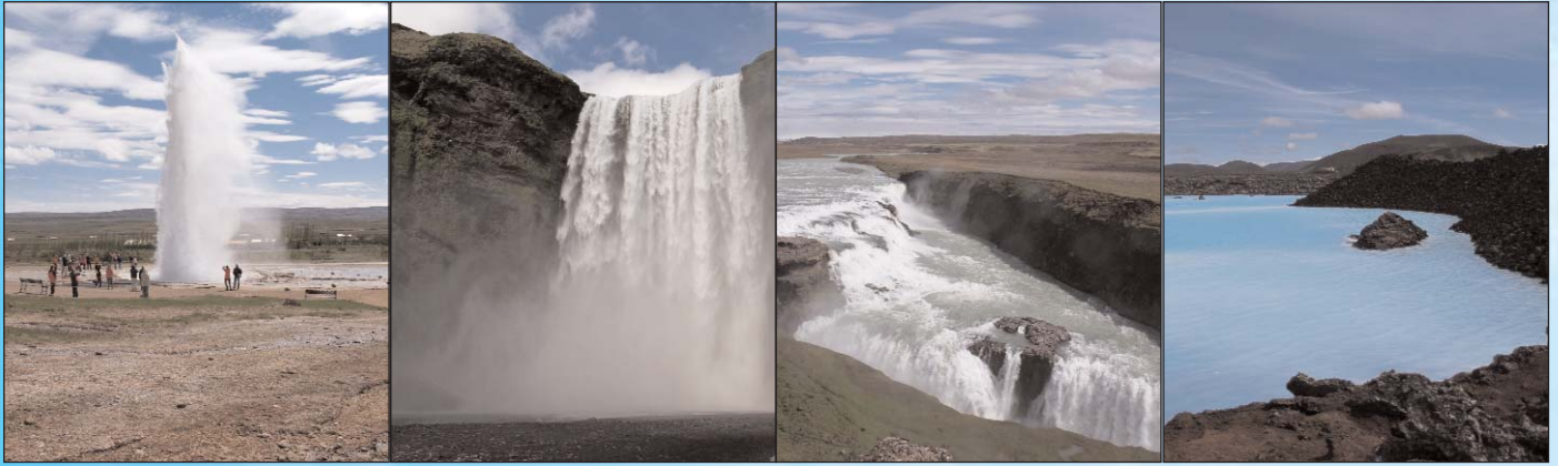
Auf Island hat Wasser viele spektakuläre Gesichter: Geysir, Skogafoss Wasserfall, Kaskaden im Thingvellir Nationalpark, See nahe Blue Lagoon. (v.li.)