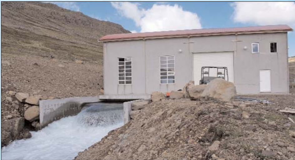
In Island gelten spezielle hydrologische Gesetze: Das größte Wasserdargebot ist im Winter.