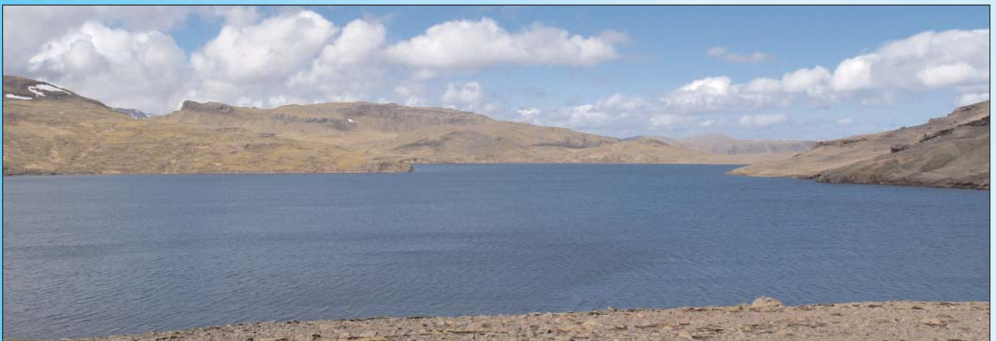
Zwei natürliche Seen auf unterschiedlichen Höhenstufen werden von den Kraftwerksbetreibern genutzt. Der obere dient dabei als Speicher.