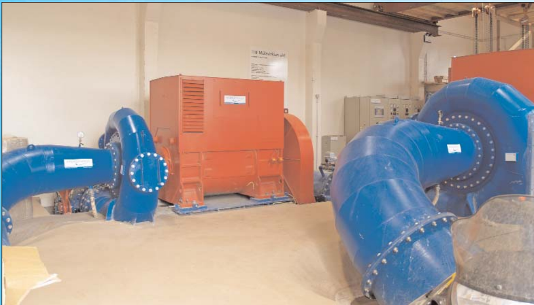
Zwei ungleich große Francis-Spiralturbinen von Gugler Hydro Energy treiben Generatoren von Siemens an.

des Wassers möglich. Aber nicht überall ist sie auch gewünscht“, spielt er unter anderem auf die entschlossene Haltung der isländische Naturschützer an, die schon so manches Projekt zu Fall gebracht haben.