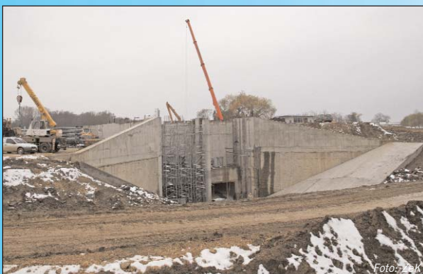
Im Januar sollten die Bauarbeiten für das Kraftwerk abgeschlossen sein.

„Ein Problem für uns war die Finanzierung. Seit unseren ersten Berechnungen, die bei 1,6 Mrd HUF (rund 6,2 Mio Euro) lagen, waren Monate vergangen - und zum