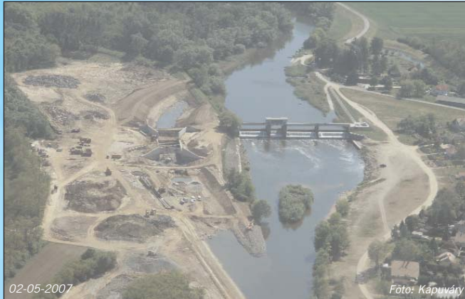
Das erste größere Kleinwasserkraftwerk in Ungarn seit über 50 Jahren entsteht an der Raab unweit von Répcelak. Rund 8,2 Mio. Euro kostet die Anlage.