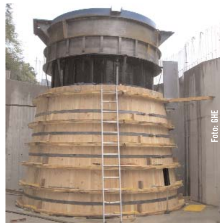
Beste Zimmermannsarbeit für das Saugrohr

In Summe erzeugt der Maschinensatz ungefähr 5,2 Mio. kWh. Dieser Jahresertrag bedeutet für das Böhler-Werk in Sonntagberg eine Erhöhung des Eigenversorgungsanteils von bisher 32 auf nunmehr 55 Prozent. Und das mit einem Ausleitungskraftwerk, das aus ökologischer Sicht Vorzeigecharakter aufweist. Für das Team der „Technischen Instandhaltung und Investitionen“ erwies sich der Exkurs in das für sie bislang unbekannte Terrain der Kleinwasserkraft als interessante und wahrscheinlich sehr nützliche Erfahrung. Schließlich könnte dieses Know-how noch das eine oder andere Mal von großem Nutzen für das Unternehmen sein.