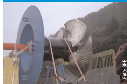
Anlieferung des Laufrades