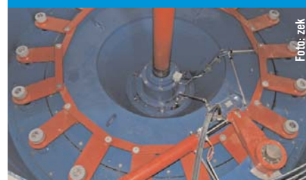
Turbinentechnik aus dem GHE-Werk in Niederranna