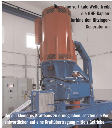
Über eine vertikale Welle treibt die GHE-Kaplanturbine den Hitzinger-Generator an.