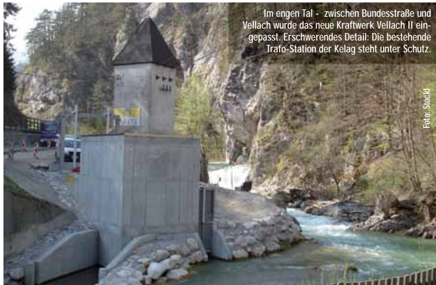
Im engen Tal - zwischen Bundesstraße und Vellach wurde das neue Kraftwerk Vellach II eingepasst. Erschwerendes Detail: Die bestehende Trafo-Station der Kelag steht unter Schutz.

Mit großem Engagement hat sich ein Unternehmer aus dem Salzburger Saalbach in Österreichs südlichster Marktgemeinde, in Bad Eisenkappel, einen lang gehegten Wunsch erfüllt: den vom eigenen Kleinwasserkraftwerk. Welch gute Voraussetzungen das genutzte Gewässer - die Vellach - für diesen Zweck mitbringt, verriet schon der Umstand, dass bei einer Ausleitungsstrecke von lediglich circa 60 Metern eine Fallhöhe von 5,5 Metern nutzbar ist. Mit einer modernen Kaplan-Schachtturbine von HydroEnergy produziert das neue Laufkraftwerk rund 1,5 Millionen Kilowattstunden Strom im Jahr.