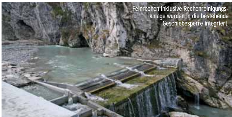
Feinrechen inklusive Rechenreinigungsanlage wurden in die bestehende Geschiebesperre integriert.

Mit Vorliegen der Baugenehmigung erfolgte Anfang Oktober prompt der Startschuss für die Bauarbeiten. Sie standen allerdings nicht