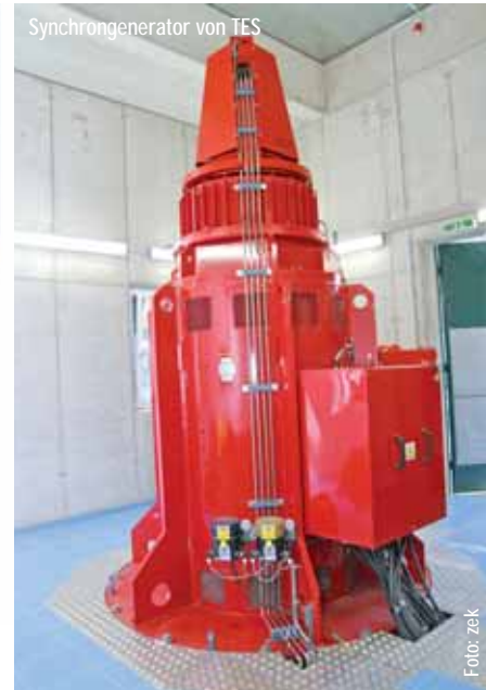
Synchrongenerator von TES