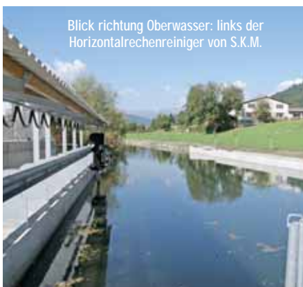
Blick richtung Oberwasser: links der Horizontalrechenreiniger von S.K.M.

Doch das eigentliche Herz der Anlage ist im neuen Krafthaus installiert, das beinah in direkter Nachbarschaft zum alten Maschi-