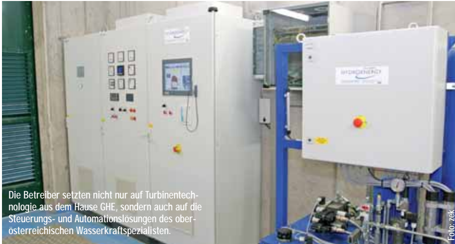
Die Betreiber setzen nicht nur auf Turbinentechnologie aus dem Hause GHE, sondern auch auf die Steuerungs- und Automationslösungen des oberösterreichischen Wasserkraftspezialisten.