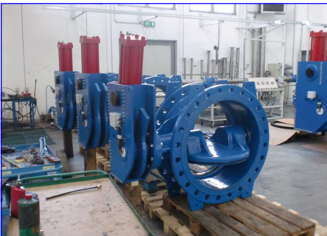
Einlaufklappe butterfly valve