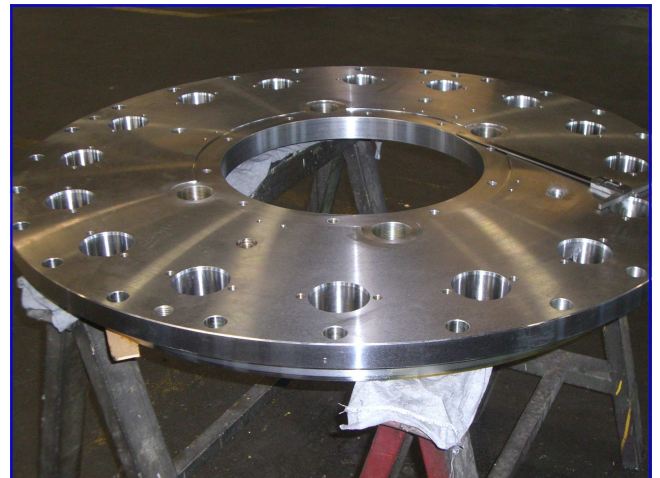
Leitradring guide vane ring