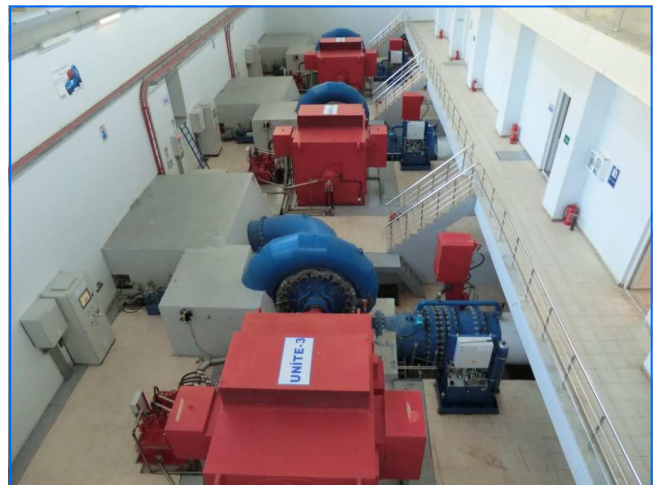
Turbinenhaus power house