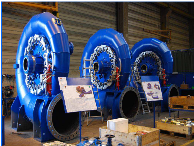
Montage im Werk factory assembling