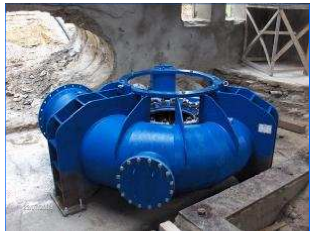
Versetzen Turbine I Cogging Turbine I