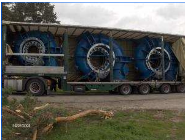
Lieferung Turbine zum Kraftwerk Delivery Turbine to the power house