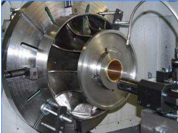
Fertigung Francis Laufrad Manufacturing of the francis runner