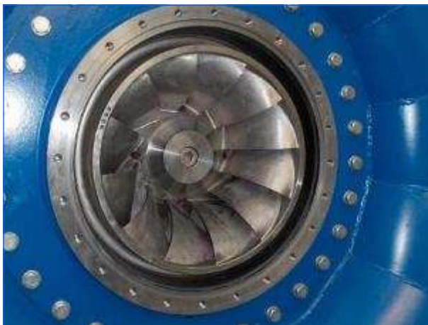
Francis-Laufrad eingebaut Francis-Runner fitted