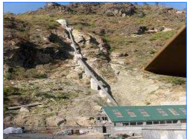
Einlaufrohrleitung Inlet penstock