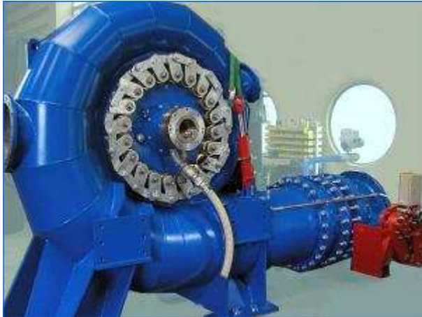
Francis Spiral Turbine vor Auslieferung Francis Spiral turbine before delivery