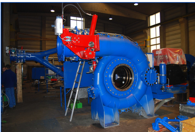
Montage Turbinen Mounting turbines