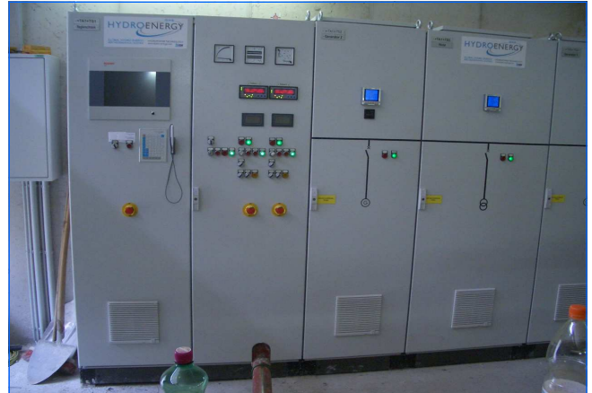
Schaltschrank Control cabinet