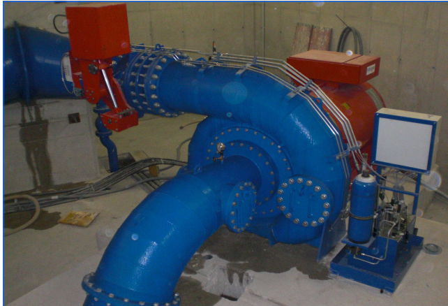
2-düsige Francis-Turbine 2-nozzle Francis-turbine