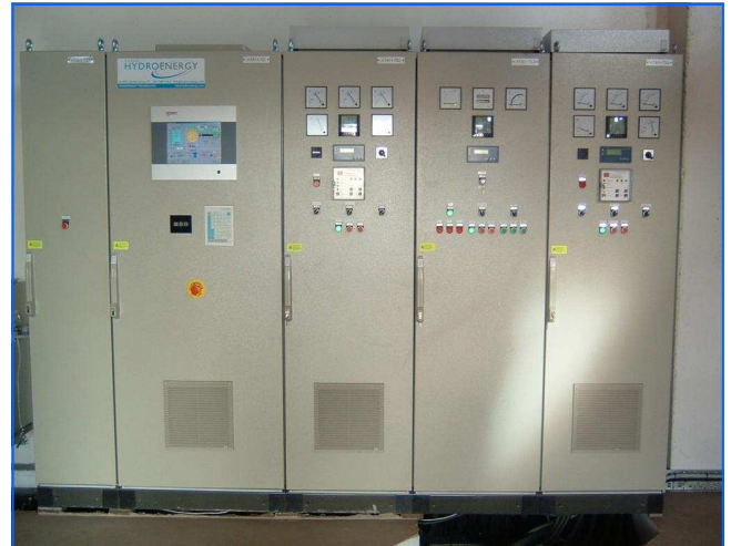
Elektrische Schaltanlage Electronical control system