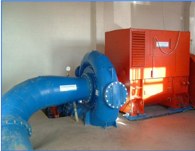
Krafthaus Power house