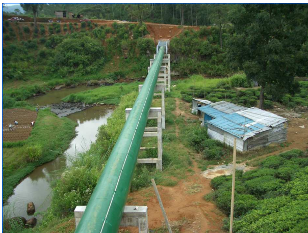
Einlauf Druckrohrleitung Inlet penstock