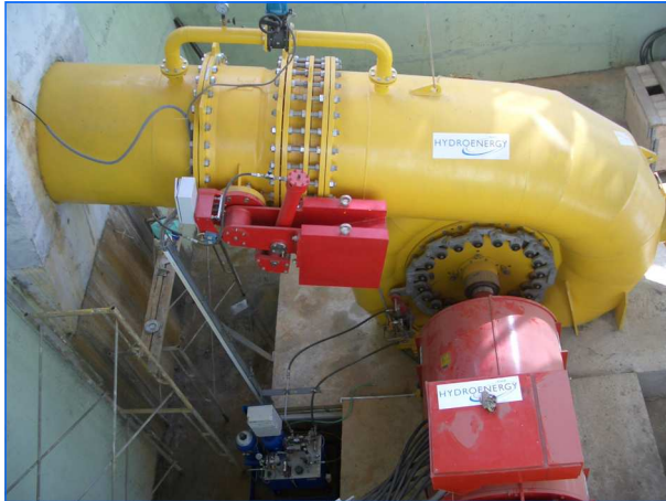
Turbine im Montagezustand Turbine in assembling status