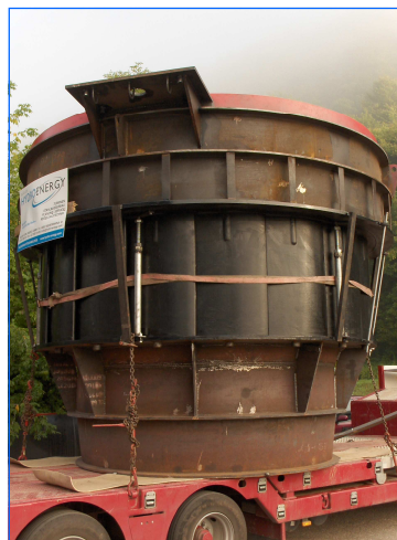
Transport Turbine Transport turbine