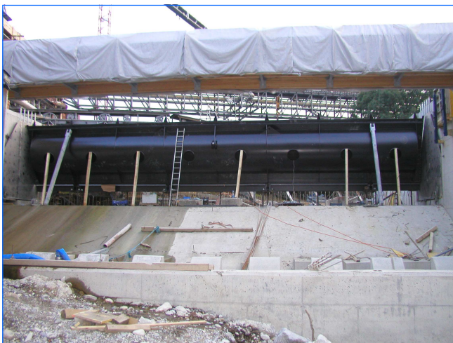
Stauklappe Air vane