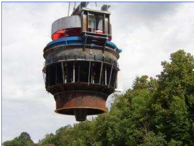
Montage Turbine mit Kran Assembly turbine with crane