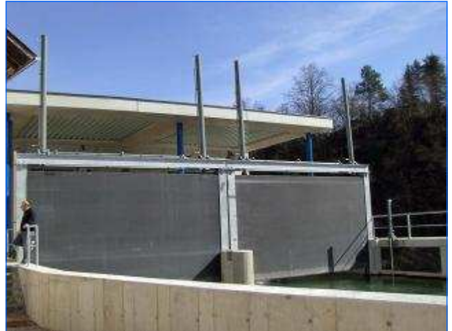
Feinrechen Trash rake