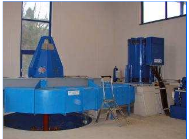
Kaplan-Schachtturbine Kaplan-Open flume turbine