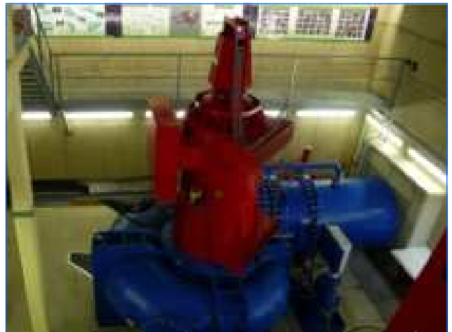
Fertig installierte Turbine turbine mounted in powerhouse