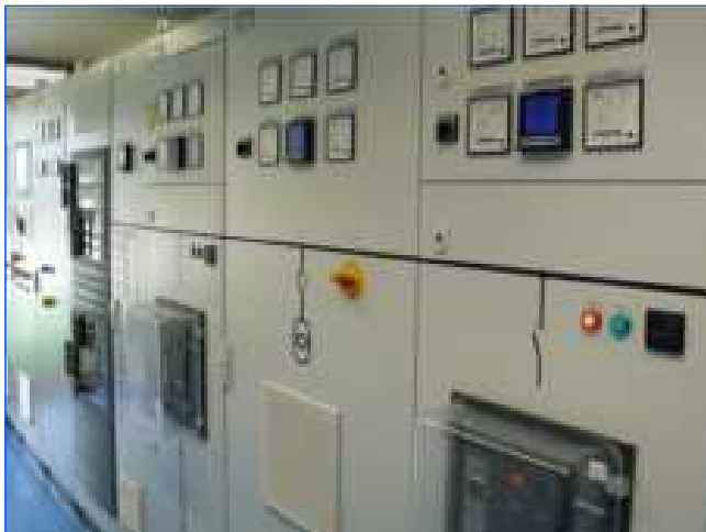
Elektroschaltanlagen low voltage switch boards