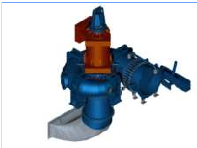
CAD Zusammenstellung CAD assembling