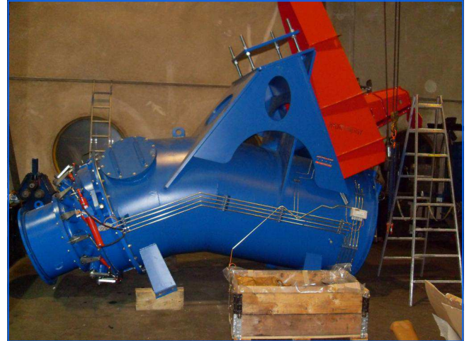
Kaplanrohrturbine bulb turbine