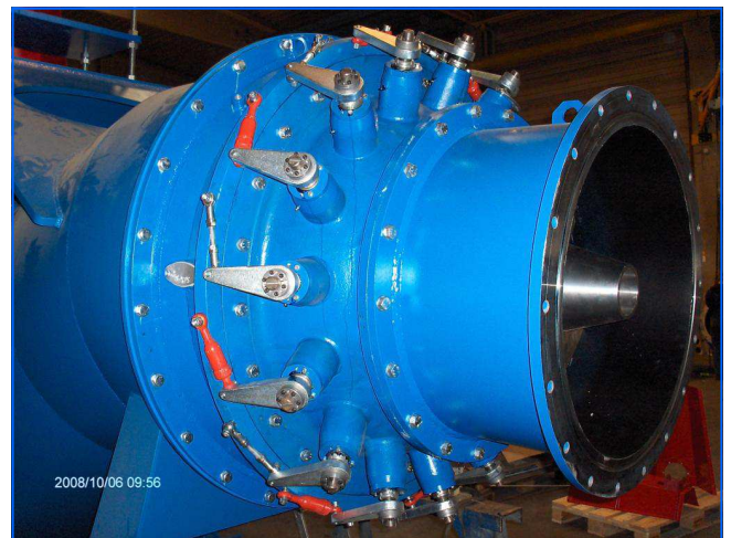
Leitapparat guide vane apparatus