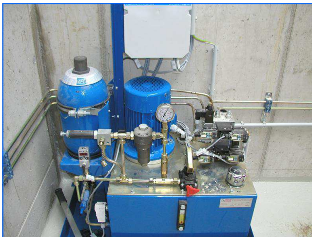
Hydraulikaggregat Hydraulic unit