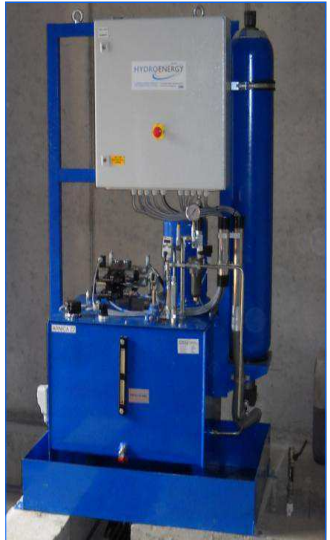
Turbinenhydraulik turbine hydraulic