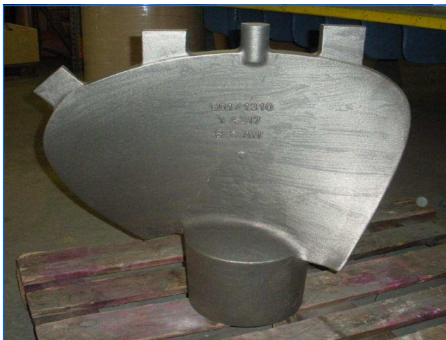
Kaplanflügel Guss casting of Kaplan blade