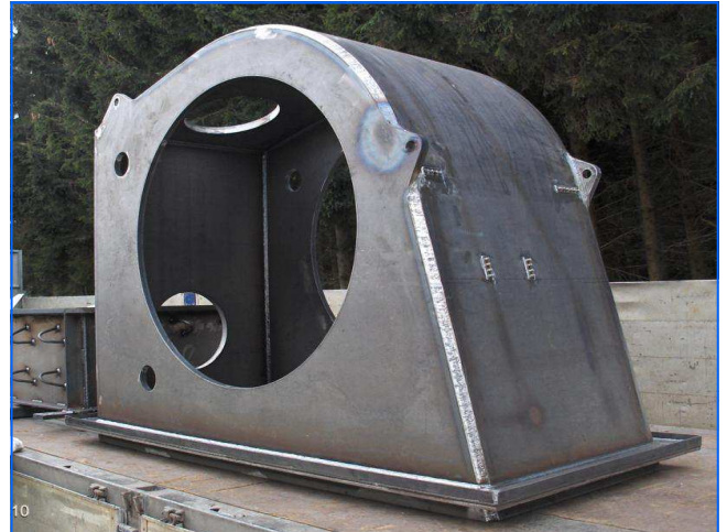
Fertigung Gehäuse production housing