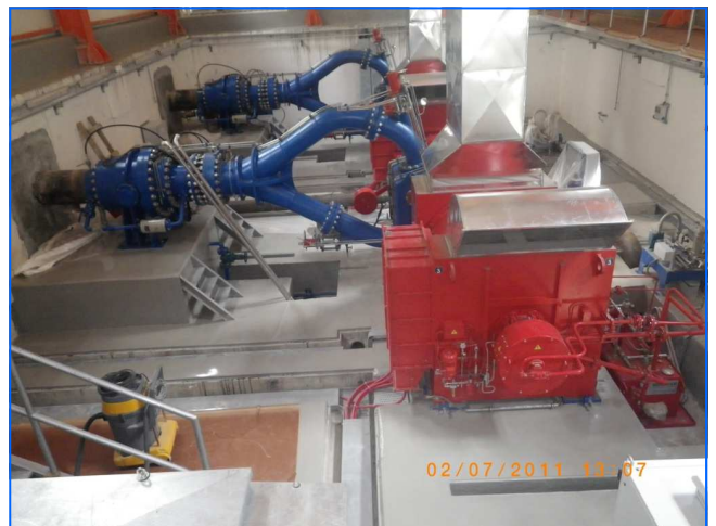
Turbinenhaus power house