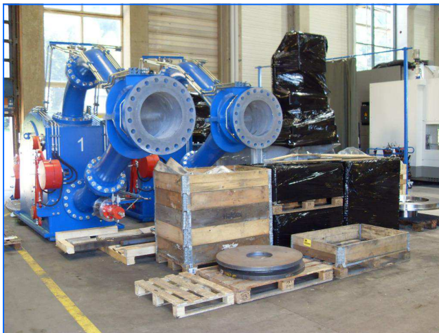
Turbinenauslieferung transport of turbines