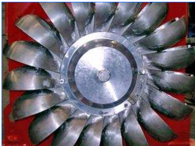
Peltonrad in Monobloc - Bauweise Pelton runner in monobloc design