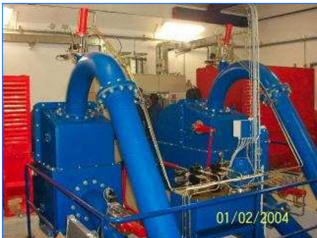
Beide Turbinen in Betrieb Both turbines in operation