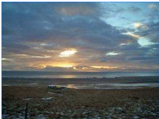
Abendstimmung in Island Evening spirit in Iceland