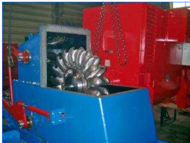
Montage des Laufrades bei HYDRO ENERGY Montage of the runner at HYDRO ENERGY