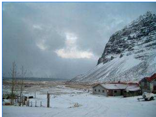
Insel im Winter Iceland in winter