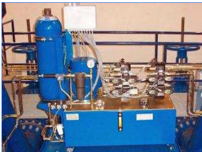
Hydraulikeinheit Hydraulic unit