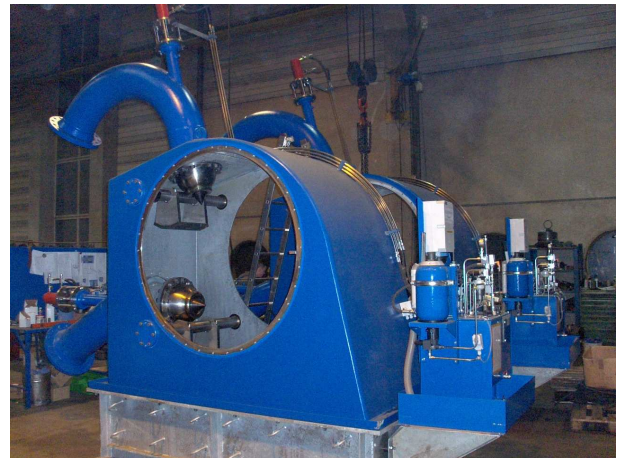
Zusammenbau bei HYDRO ENERGY Assembling at HYDRO ENERGY