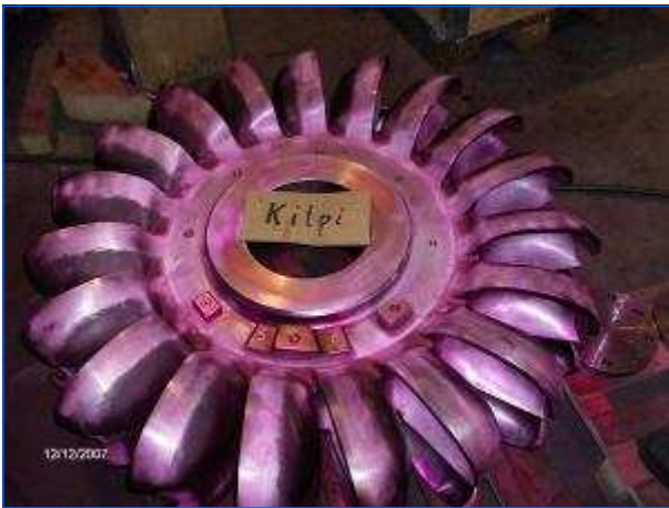
PT-Prüfung Laufrad PT-Inspection Runner