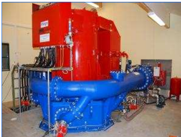
Inbetriebgenommene Turbine Installed Turbine