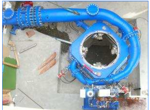
Draufsicht Plan view