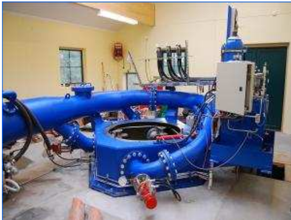
Turbine im Montagezustand Turbine in assembling status