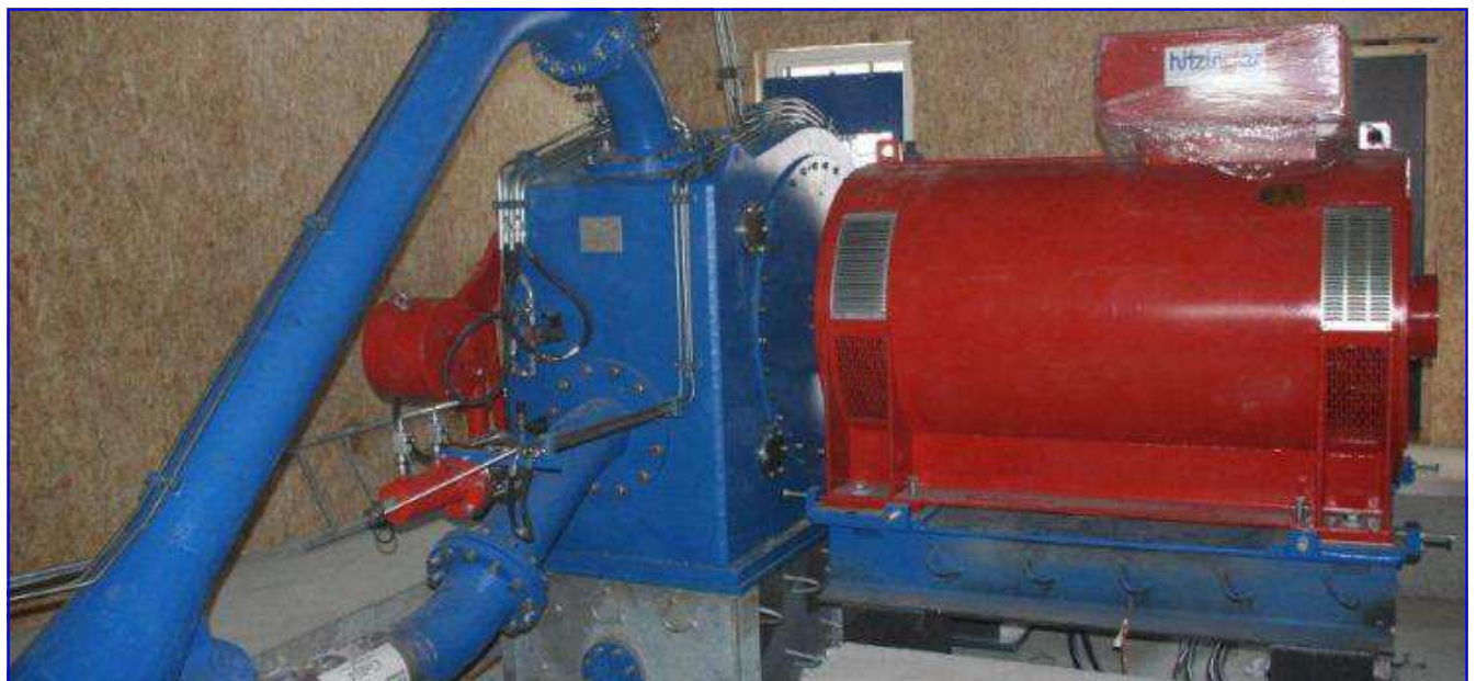
Pelton Turbine Pelton turbine