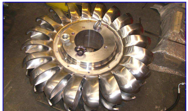
Pelton Laufrad Pelton runner