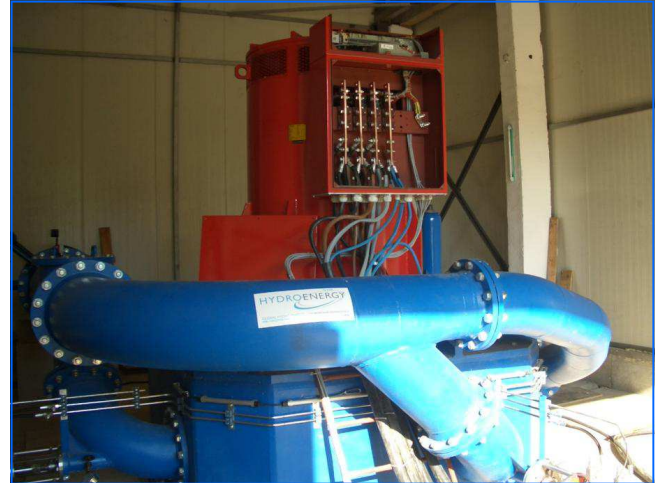
Montierte Turbine mounted turbine