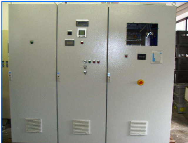
Elektronische Schaltanlage electronical control system