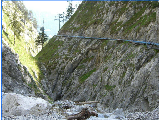
Zulaufleitung Inlet pipe