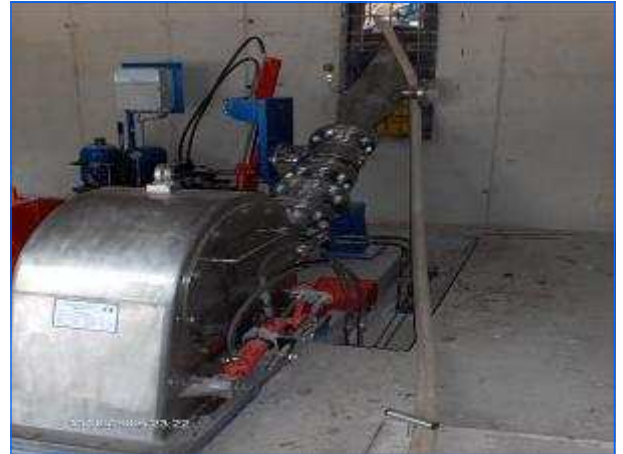
Fertig montierte Turbine Finished mounted turbine