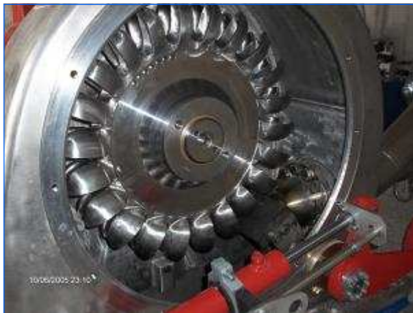
Montierte Pelton Turbine Mounted Pelton Turbine